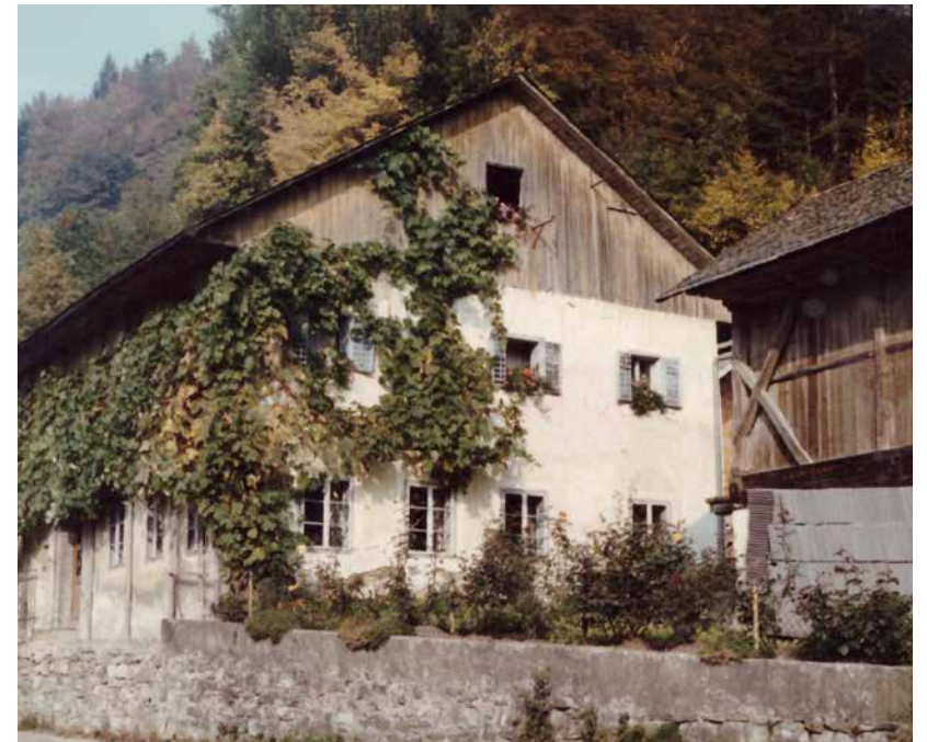
Potokarjeva hiša na Studenem leta 1979

Hišnim imenom so dodane še delno poknjžene oblike, to je narečnemu izgovoru kar najbližji zapis z znaki slovenske abecede s poknjženo končnico imena.