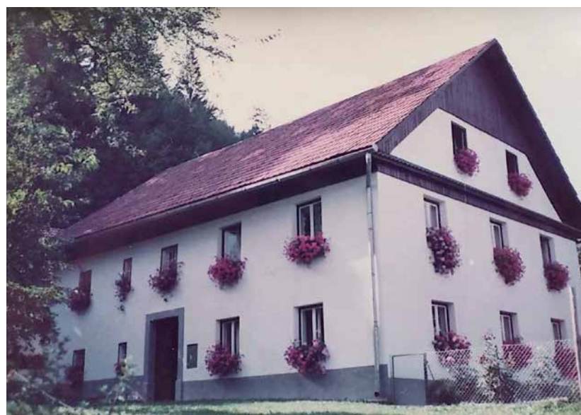
Pri Ozebku po obnovi okoli leta 1980