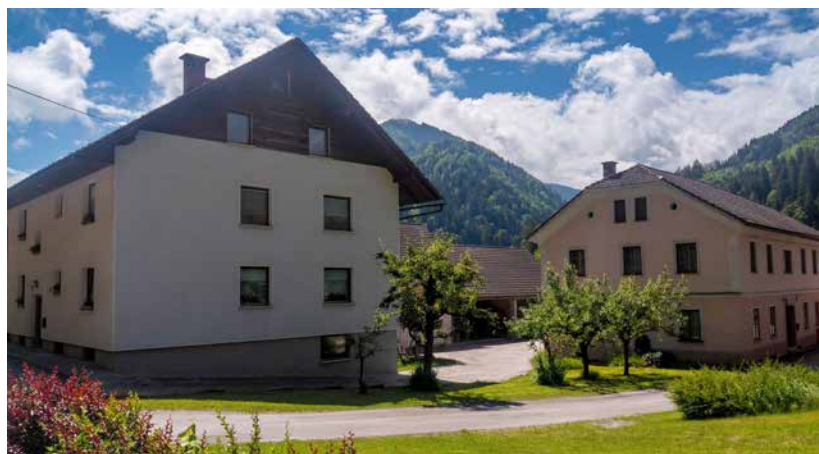
Pri Prešniku desno in Pri Jeralu levo