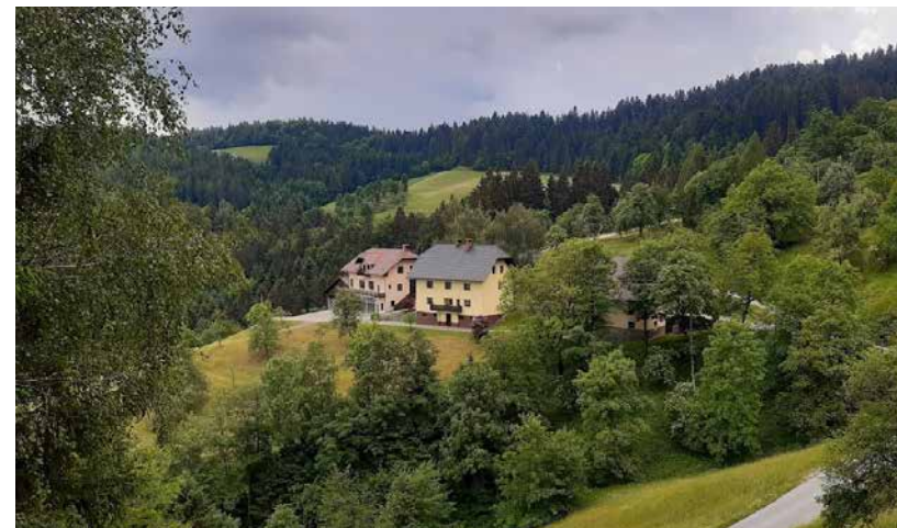
Pri Krulcu

V vasi so bile zanimive zamenjave lastništva oz. selitve ljudi med hišami. Finovčevo kmetijo s staro hišno številko 6 so kupili Brnovi, ki so takrat živeli na sosednji lokaciji, na hišni številki 5. Finovčevi pa so kupili Ozeblkovo kmetijo in se preselili tja.