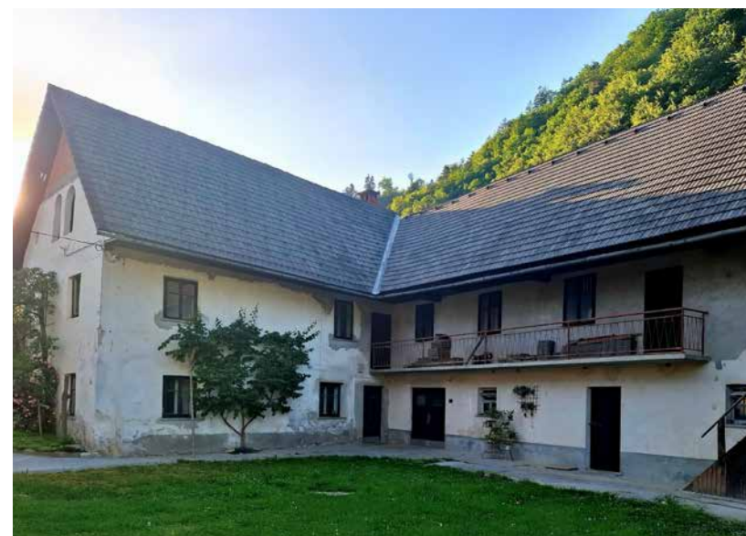
Stara hiša Pri Šraju, zgrajena leta 1797

Pri Šraju je bila včasih največja kmetija na Studenem, za bogato domačijo Pri Jernaču pa sokrajani poznajo anekdoto, da so imeli v lasti toliko zemlje, da so po svoji zemlji prišli do Železnikov, razprostirala se je torej vse do tja, gospodar pa naj bi imel toliko denarja, da si je z bankovci prižgal tobak.