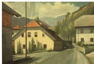
Na sliki Markova hiša (desno) in hiša Pri Štefanki (levo) v 90-ih letih (vir: arhiv Tanje Kramar, avtor slike: Jensterle)