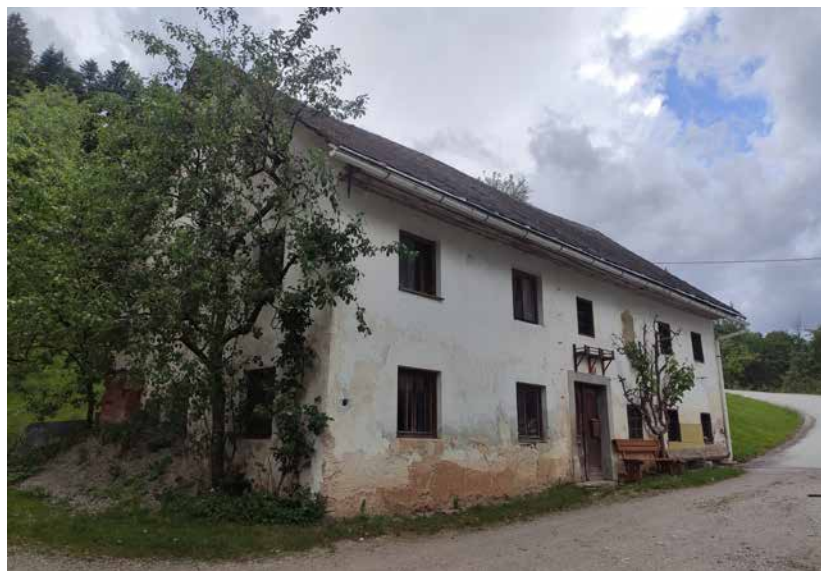
Stara hiša na domačiji Pri Brnu

Pri Brnu, kjer naj bi hišno ime nastalo že pred letom 1800, so bile po podatkih lastnikov značilne dejavnosti vezave knjig, mizarstvo in sadjarstvo, na Trojarjevi domačiji pa so se poleg kmetijske dejavnosti ukvarjali še z gozdarstvom, oglarstvom, kolarstvom in furmansko dejavnostjo.