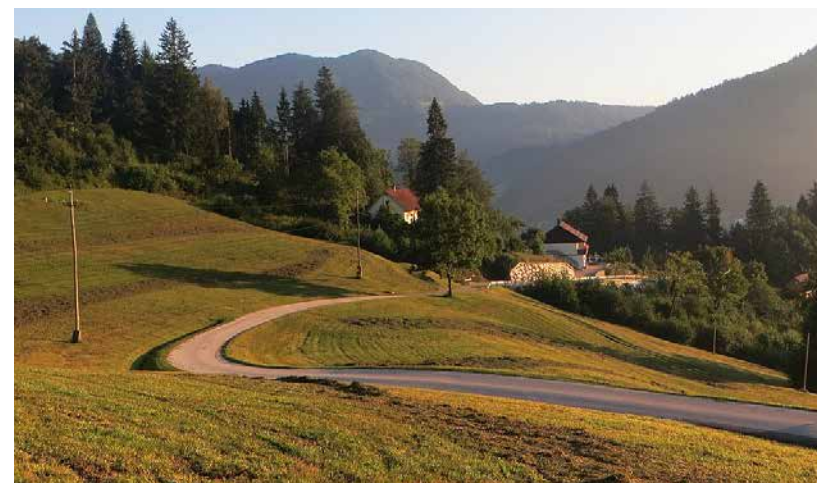
Pri Mižetu